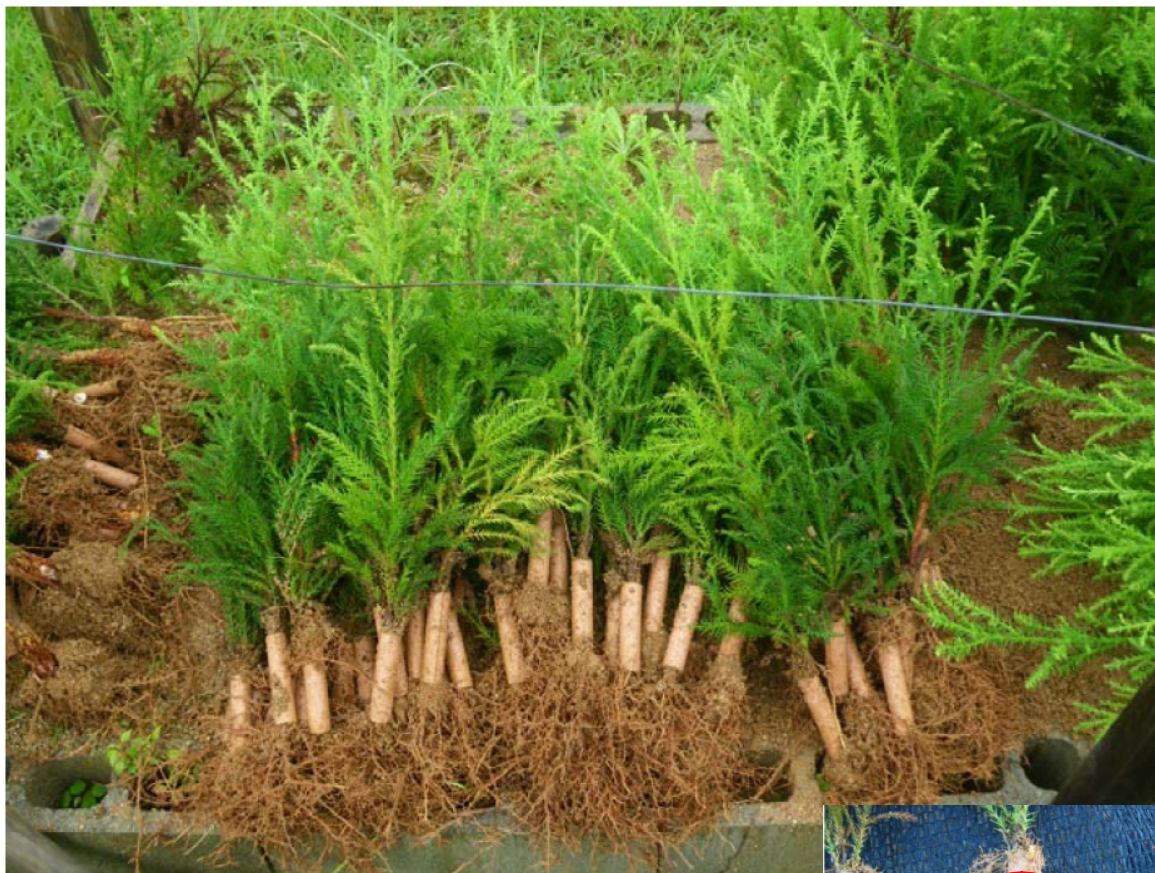
写真 「植栽後数ヶ月でセラミックから根が溢れ出たスギ苗木」